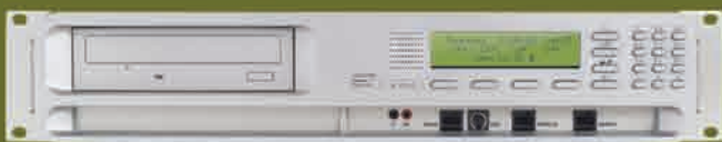
Call Recorder PRI | ISDN II | Octo/Quarto