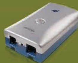
Call Recorder PICO

the headset's make, it can record from desktop phones and mobile or from desktop phones and softphone.