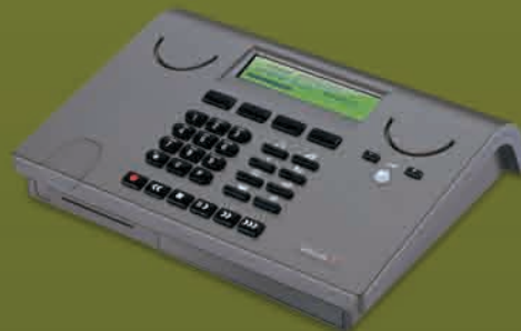
Call Recorder Single | Feature Phone