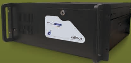
Call Recorder Milagro | Apresa

Vidicode Call Recorder Octo i Quarto to oczywisty wybór w sytuacji, gdy istnieje konieczność nagrywania rozmów na kilku liniach analogowych na raz. Urządzenia są dostarczane z buforem o pojemności ponad 40.000 godzin nagrań i interfejsem użytkownika dostępnym poprzez sieć LAN. Ich niezawodność wzbudza uzasadnione zaufanie i pozwala na użycie rejestratorów Vidicode nawet w najbardziej wymagającym środowisku.